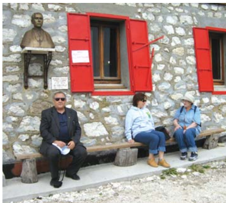
Terminillo (Rieti), 9 agosto 2006, devoti del Venerabile Massimo Rinaldi davanti al rifugio e al busto del Rinaldi (foto di Angela Alfonsi, Santa Rufina di Cittaducale (Rieti))

una degna, sincera, esemplare commemorazione. La sua fisionomia personale e spirituale, richiama quella dei tipi francescani umbri e sabini, del più genuino periodo medioevale, pastore e agricoltore, sacerdote e missionario, soprattutto missionario: pronto e spedito in tutto, fedele al suo dovere, di giorno e di notte; semplice e modesto; non asceta però, non mistico, altroché forse nel fondo inesplorato dell'anima; uomo di buon senso e di buon cuore; incurante di sé e del suo, che egli riteneva non suo ma dei poveri. Visse sempre alla buona, senza pompa né fasto. Alla pompa doverosa delle sacre funzioni episcopali egli si adattava, potrei dire si sottoponeva con un abbandono di sacrificio. Parco, laborioso senza soste, indurito alla fatica, al freddo, alle privazioni e disagi, in quelle sale del suo palazzo vescovile dove si soffocava l'estate, e l'inverno si gelava; ed egli, per poter lavorare dietro un suo piccolo tavolo a scrivania, a volte sino a notte