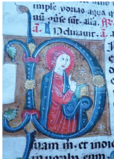
Archivio Capitolare di Rieti, fondo Codici, n. 1, Breviario e Messale sec. XV, Capolettera miniata

è con un senso di voluta disciplina che dobbiamo attendere che l'Autorità Ecclesiastica, giudichi in merito. È a lei Monsignore Reverendissimo, che abbiamo voluto esprimere questi nostri sentimenti, come rappresentante di quella Diocesi che ebbe la fortuna di averlo per suo Vescovo per tanti anni» [...].