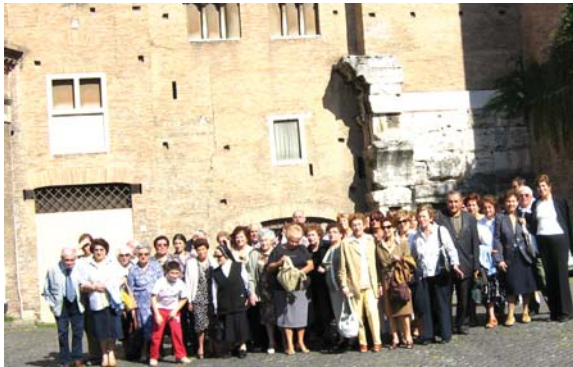
Roma, 22 settembre 2007, devoti del Venerabile Massimo Rinaldi davanti alla basilica dei SS. Pietro e Paolo

tombe dei papi sia nella basilica dei SS. Giovanni e Paolo, dove è stata celebrata la santa messa. L'itinerario della basilica dei Santi Giovanni e Paolo era stato programmato per ricordare che il Venerabile Massimo Rinaldi aveva presso questa basilica, come direttore spi-