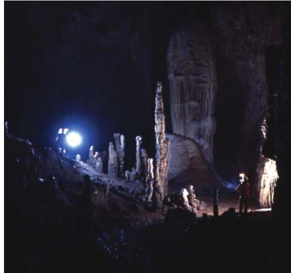
Stalattiti e stalagmiti, in una veduta notturna delle grotte carsiche di Val de' Varri, nel comune di Paecorocchiano RI

La solitudine in cui vive quella popolazione è tale che, specialmente la gioventù avvicina il forestiere non solo con