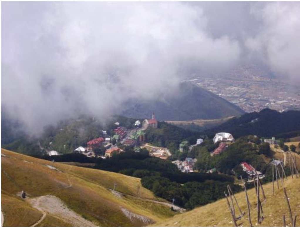
Terminillo (Rieti), 12 agosto 2007, panorama del massiccio del Terminillo ripreso dal rifugio del Venerabile Massimo Rinaldi con Pian de' Valli, la chiesa di S. Francesco e, in lontananza, la città di Rieti

tarda, affondava i piedi e le scarpe, spesso rotte, in una rozza cassetta di legno dove vuotava il suo cestino delle carte strappate. Dormiva in un'alcovetta sopra un piccolo materasso disteso a coperchio di due casse accostate; ovvero, nei pomeriggi estivi s'accoccolava per pochi minuti rannicchiato sopra due sedie. Ma tutto ciò egli faceva con semplicità, con volto sempre ilare, un po' canzonatorio, sorridendo di compassione quando gli si suggeriva di fornirsi di una vettura automobile, che gli permettesse di percorrere celermente le non brevi distanze tra parrocchia e parrocchia della sua vastissima Diocesi. «Certo, andrei più lesto e più comodo – rispondeva –; ma non vedrei quasi nessuno, non ascolterei da vicino, come faccio andando a piedi, il povero, il viandante, il derelitto, lo sperduto nella montagna, nella selva». Diceva che questi ne sanno di più, anche sul conto dei preti e dei parroci. La sua croce episcopale con catena non era di oro ma di piombo indorato: quella aurea, donatagli dagli amici alla sua nomina, l'aveva