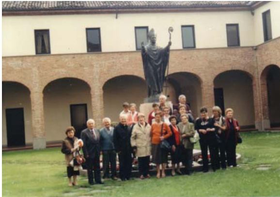
Piacenza, Casa madre degli Scalabriniani, 30 aprile 2007, devoti del Venerabile Massimo Rinaldi ai piedi del monumento al Beato Giovanni Battista Scalabrini

La ripresa del viaggio è avvenuta alle ore 11,40, con successiva consumazione del pasto in autogrill. Quindi la partenza per Piacenza, con l'arrivo alle ore 17,10 presso