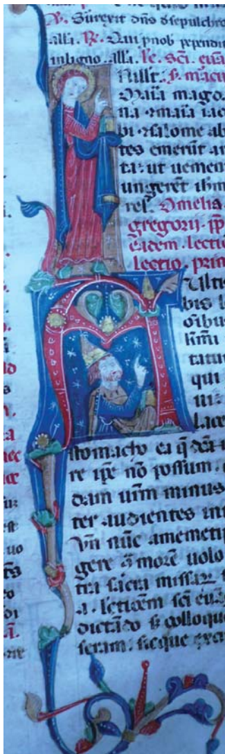
Archivio Capitolare di Rieti, fondo Codici, n. 1, Breviario e Messale sec. XV, Capolettera miniata