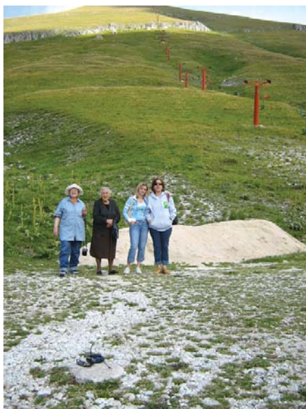
Terminillo (Rieti), 9 agosto 2006, devote del Venerabile Massimo Rinaldi in attesa di raggiungere il rifugio al fine di preparare la messa per 13 agosto 2006

La nostra conoscenza datava da oltre trent'anni, da quando Egli tornato dal Brasile, interrotta colà l'attività sua missionaria scalabriniana di assistenza agli italiani ivi emigrati, fu per vario tempo Rettore della chiesetta romana di S. Giovannino della Malva in Trastevere, che Egli officiava decorosamente da solo: pio, zelante, senza eccessivo pietismo, premuroso verso tutti, specialmente verso i poveri e i bisognosi, preciso e puntuale sempre nell'orario delle sacre funzioni, che celebrava con sostanziale brevità, quasi sempre aggiungendo al rito liturgico una sua parola semplice e fervorosa, di devota considerazione, di esortazione fraterna: specialmente la domenica, alla Messa