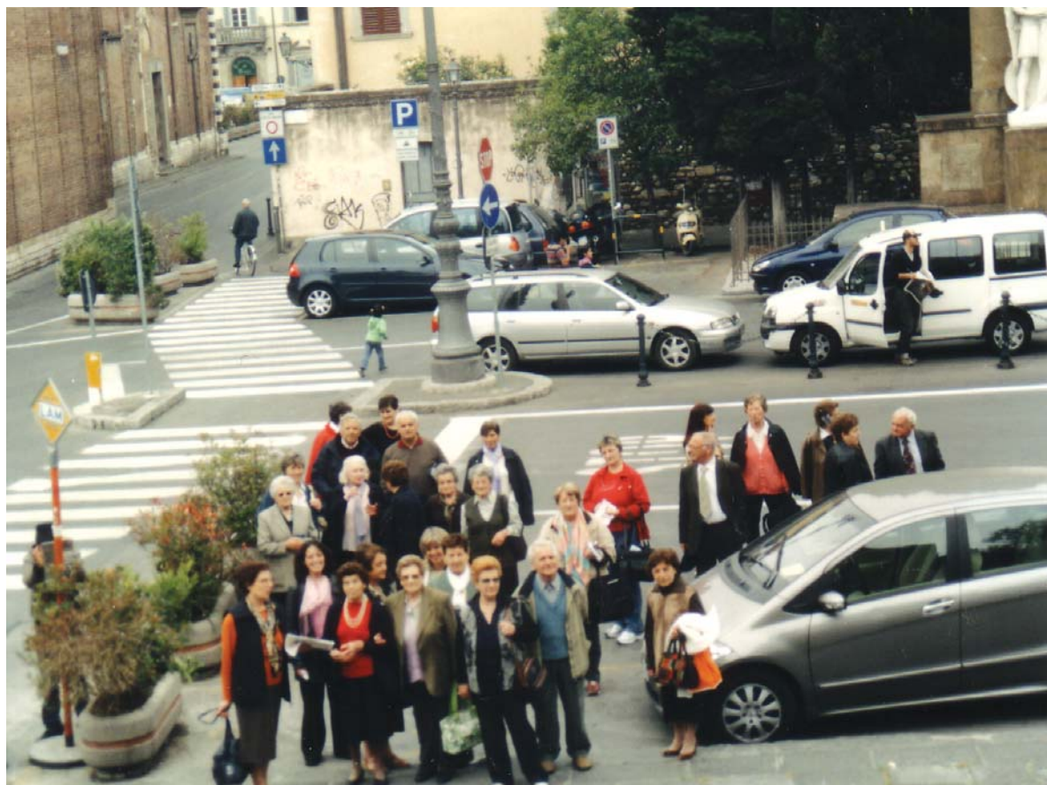
Prato, piazza del castello dell'imperatore Federico II, 30 aprile 2007, devoti del Venerabile Massimo Rinaldi in visita al centro storico della città

Robbia. Visitato il centro della città ci siamo quindi recati nella basilica cattedrale ad ossequiare, tra l'altro, la reliquia del Sacro Cingolo. In ultimo è stato visitato il castello di Federico II, posto in posizione strategica e caratteriz-