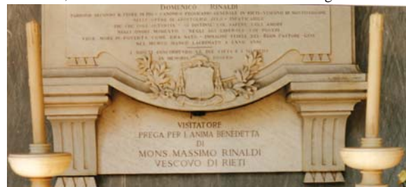
Rieti, cimitero comunale, monumento al vescovo Domenico Rinaldi, particolare della tomba che custodì il corpo incorrotto del Venerabile Massimo Rinaldi (foto di T. Rossi e O. Mariantoni, Rieti 2006)

Troppo lungo sarebbe l'enumerarvi qui i singoli benefici che il sacerdote cattolico ha recati ed arreca in ogni tempo all'individuo, alla famiglia alla società. Il sacerdote cattolico, o fratelli, rivestito della medesima autorità di Gesù Cristo e tenuto a continuare la sua medesima divina missione, spende la sua vita a pro dell'umanità, si rende servo dell'uomo e dalla culla alla tomba attende amoroso al di lui bene. Ne raccoglie il primo vagito, ne asciuga le lacrime, ne risana le ferite, ne raccoglie gli ultimi respiri e il di lui corpo ridona alla terra, la di lui anima al creatore. Come un giorno Gesù