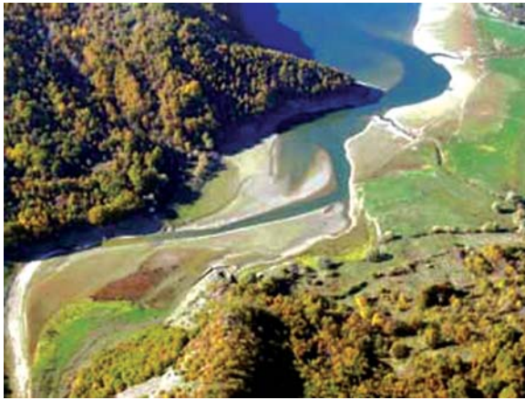
La Valle del Salto (foto da internet, sotto voce Cicolano)

«Primo novembre 1938. A Pace, paesello di montagna, una piccola comunità di suore è raccolta a pranzo attorno alla Madre Generale. Fuori fa freddo e piove a dirotto. Alla fine del desinare, arriva inaspettato il vescovo, accompagnato da un giovane sacerdote carmelitano. Sono bagnati da capo a piedi e infangati. Le suore pregano il vescovo di cambiarsi, in modo da potergli asciugare e pulire gli abiti; ma egli, schermendosi, si prende una seggiola e s'accosta al caminetto. Intanto racconta con semplicità, come se fosse la cosa più naturale del mondo, che è partito da Rieti alle tre del mattino, s'è fermato in due paesi senza parroco per celebrare la messa, e poi è arrivato lassù, sempre a piedi. La Madre Generale gli domanda: — Come mai questa improvvisata, oggi? Pensavo che fosse a Rieti per il pontificale di Tutti i Santi.