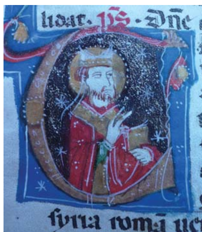
Archivio Capitolare di Rieti, fondo Codici, n. 1, Breviario e Messale sec. XV, Capolettera miniata