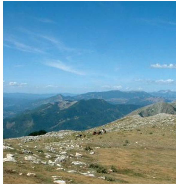
Veduta dei Monti della Duchessa

E si allontana con un breve gesto di benedizione».