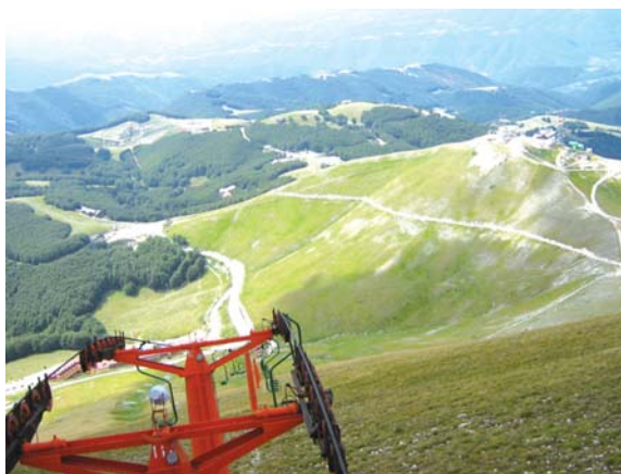
Terminillo (Rieti), 13 agosto 2006, panorama del massiccio del Terminillo ripreso dal rifugio del Venerabile Massimo Rinaldi

delle 10, dove io accompagnavo la vecchia Mamma, sua penitente. Lo si vedeva allora spesso verso sera discendere in fretta col suo rapido passo consueto, rimastogli sin quasi agli ultimi mesi, dall'Istituto Don Guanella a S. Pancrazio, dove assisteva spiritualmente quelle povere Suore addette al servizio ed alla cura dei deficienti, dei rifiuti della società e del vivere civile. Da Vescovo, quale lo volle, contro ogni suo desiderio e ogni suo pensiero, il Pontefice Pio XI, Mgr. Massimo rimase tale e quale, sempre così, solo accelerando il ritmo della sua operosità benefica, sacerdotale e pastorale. La sua vita onora il benemerito Istituto dei Preti di S. Carlo, a cui appartenne; onora la Chiesa Vescovile di Rieti; onora, di là dai limiti della sua modesta esistenza, il genere umano. Non mi è possibile, in questo doloroso momento, raccogliere in brevi commosse parole le linee caratteristiche della sua singolare figura. Egli merita dalla sua Diocesi,