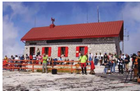
Terminillo (Rieti), 12 agosto 2007, rifugio del Venerabile Massimo Rinaldi: devoti dinanzi al Rifugio

Anche il Vicario generale dei Missionari di San Carlo, padre Stella, si è unito alle parole di monsignor Maceroni con l'entusiasmo della prima volta: «Come Scalabriniani a Massimo Rinaldi dobbiamo moltissimo. Quando nel 1910