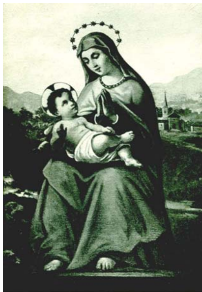
MARIA SANTISSIMA DI CAPOD'ACQUA venerata in CITTAREALE

Preghiera e immagine della Madonna di Capo d'Acqua, santuario alle sorgenti del fiume Velino presso Cittareale - RI