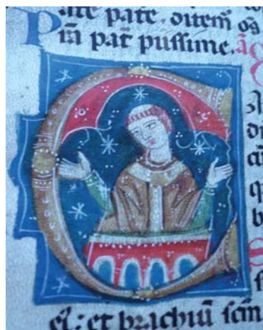
Archivio Capitolare di Rieti, fondo Codici, n. 1, Breviario e Messale sec. XV, Capolettera miniata

plare scomparso fu Professore nel Seminario Vescovile di Venosa, poi Parroco ad Arlena e più tardi Arciprete dell'insigne Cattedrale di Montefiascone, e lasciò ovunque orme indelebili di sapiente ed attivissima operosità. Fu sempre perciò in grande stima presso i vari Vescovi falisci ed eziandio di altre diocesi. Nei difficili tempi della guerra mondiale direbbe per qualche anno a Piacenza il Collegio Cristoforo Colombo dei Missionari di San Carlo, ammirato non solo dalla Direzione generale dell'opera scalabriniana, ma altresì dal Clero piacentino e dal Pastore diocesano che molto si valse dell'opera sua. E quando l'attuale nostro Vescovo fu costretto a prendere il governo della nostra diocesi, consapevole a prova del valore del Sacerdote scomparso lo volle