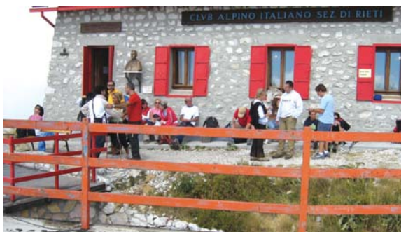
Terminillo (Rieti), 13 agosto 2006, devoti del Venerabile Massimo Rinaldi davanti al rifugio e al busto del Rinaldi

tarda, affondava i piedi e le scarpe, spesso rotte, in una rozza cassetta di legno dove vuotava il suo cestino delle carte strappate. Dormiva in un'alcovetta sopra un piccolo materasso disteso a coperchio di due casse accostate; ovvero, nei pomeriggi estivi s'accoccolava per pochi minuti rannicchiato sopra due sedie. Ma tutto ciò egli faceva con semplicità, con volto sempre ilare, un po' canzonatorio, sorridendo di compassione quando gli si suggeriva di fornirsi di una vettura automobile, che gli permettesse di percorrere celermente le non brevi distanze tra parrocchia e parrocchia della sua vastissima Diocesi. «Certo, andrei più lesto e più comodo – rispondeva –; ma non vedrei quasi nessuno, non ascolterei da vicino, come faccio andando a piedi, il povero, il viandante, il derelitto, lo sperduto nella montagna, nella selva». Diceva che questi ne sanno di più, anche sul conto dei preti e dei parroci. La sua croce episcopale con catena non era di oro ma di piombo indorato: quella aurea, donatagli dagli amici alla sua nomina, l'aveva