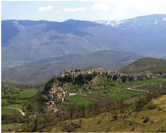
Pescorocchiano RI capolugo, nel cui territorio comunale si trova Val de' Varri (da Internet, sotto la voce Val de' Varri)

Se un giorno questa alpestre Valle che da Leofreni si distende sino a San Stefano giungerà, come è da augurarsi, ad avere almeno un centro popolato, una parrocchia ed una chiesa, ricorderà come scintilla di vita nuova sociale e religiosa anche l'opera svoltavi dal suo Vescovo nei giorni 21 e 22 agosto del 1937.