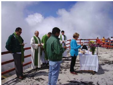
Terminillo (Rieti), 12 agosto 2007, rifugio del Venerabile Massimo Rinaldi: partecipazione di devoti alla liturgia

L'Eucaristia della XIX domenica del tempo ordinario, presieduta da monsignor Giovanni Maceroni, presidente del-