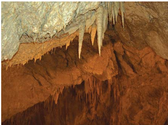
Stalattiti e stalagmiti, in uno squarcio, delle grotte carsiche di Val de' Varri nel comune di Paecorocchiano RI

Infatti Egli non contento di aver fatto dovere al parroco di Leofreni di estendere la sua azione fra le quaranta e più famiglie dimoranti lungo la valle e sui monti di quella zona, il 21 agosto volle portarvi il suo apostolato e visitare personalmente quelle povere famiglie che vivono la vita dei campi, si potrebbe dire sconosciute agli uomini e note unicamente a Dio. Esse sono prive non solo di una chiesa, ma persino di un camposanto. Il più vicino che hanno è quello di Leofreni, che del resto di camposanto ha solo il nome, tale e tanto è il suo deplorabile stato, e dista circa oltre due ore di viabilità mulattiera. Poveri rurali!