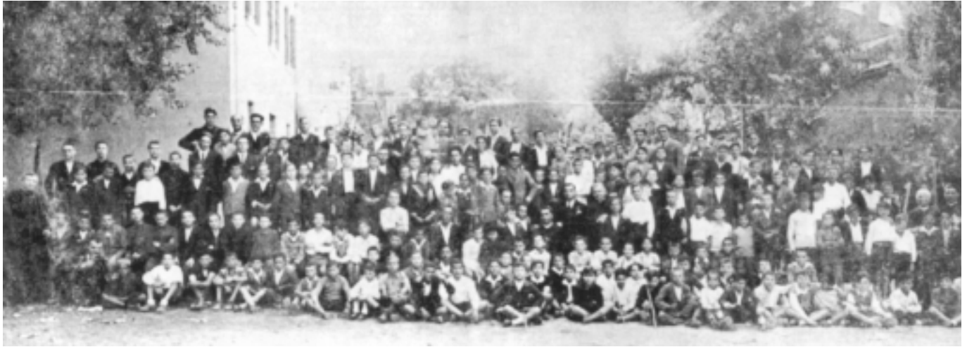
I giovani cattolici intorno all'amato pastore. Convegno Giovanile Diocesano. Ottobre 1933, tenuto nel seminario vescovile di Rieti ( Positio , II, foto 67)

dre, dove tu vai senza il figliol tuo, dove o pontefice senza il tuo ministro: A[h] padre tu dunque col martirio voli al cielo ed io orfano di te dovrò rimanere esule in terra! A[h], padre, a[h], pontefice, a[h], padre mio e di qual colpa son io reo per meritarmi di rimanermi da te diviso e forse per sempre divi-