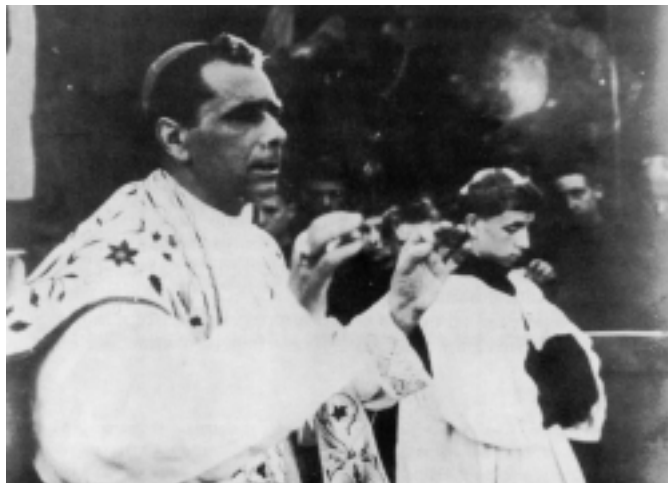
Il Venerabile Massimo Rinaldi a «Fonte Colombo predica in onore di S. Francesco d'Assisi» (Positio, II, fotografia 63)

estrema semplicità: «È stato con vero profondo dolore che questa sera dalla radio ho appresa la luttuosa notizia del trapasso di Sua Eccellenza Reverendissima. Sapevo dal giornale "Italia" di martedì di questa settimana scorsa le gravi condizioni in cui a Roma dove era degente si trovava Sua Eccellenza, e facevo preghiere a Dio per