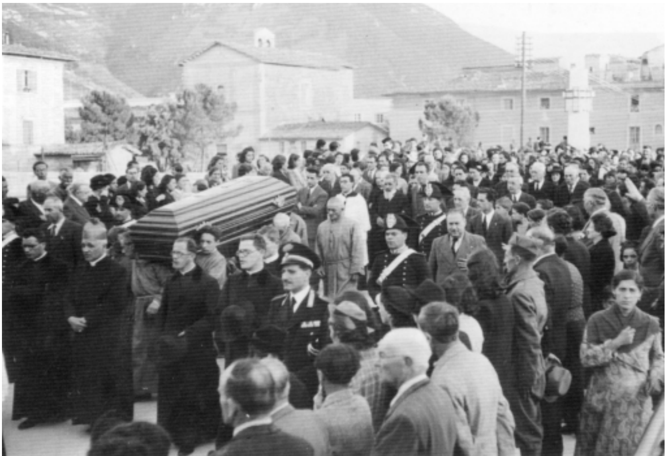
Concorso di folla ai funerali del vescovo Massimo Rinaldi, il 4 giugno 1941. Il corteo funebre, proveniente da porta Romana, si trova a piazza Cavour, nel borgo di Rieti, dove Massimo Rinaldi visse la sua fanciullezza. Nel fondo, la chiesa di Santa Cecilia, antica collegiata ora demolita, ubicata nel lato della piazza, opposto al fiume Velino (Positio, I, fotografia (44))

zione provinciale et nome intere popolazioni sabine profondissimi sentimenti vivo dolore cordoglio per scomparsa amatissimo vescovo Monsignor Massimo Rinaldi servo umilissimo e grande della cristiana fede araldo me-