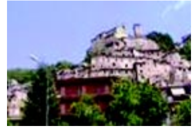
Due vedute del del centro storico di Cantalice, patria di mons. Carlo di Fulvio Bragoni