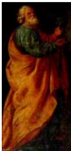
Cattedrale basilica di Rieti, particolare di una figura della cappella di S. Rocco dopo i restauri voluti dal vescovo Delio Lucarelli

impetrare la sollecita guarigione del Pastore buono, onde potesse ritornare ancora a lavorare tra i suoi amati Reatini, ma i disegni di Dio avevano disposto diversamente ... Se ci addolora la sua dipartita, ci addolcisce il pensiero che lassù in Paradiso vi è un nuovo protettore che saprà con più veemenza picchiare presso il Cuore di Dio le più elette benedizioni su tutti i suoi figli, sul Clero, su i suoi più vicini collaboratori [...]. La mia umile preghiera si unisce alla Loro per suffragare l'anima buona e Santa di Sua Eccellenza! [...]. Come lo ricordo il buon Pastore! E come ricordo i molti suoi episodi, atti di bontà, di umiltà e di sacrificio! Sono convinta che Gesù benedetto l'abbia tosto accolto tra il regno dei beati, e da lassù Ei guardi i suoi figli che piangono la sua repentina dipartita, e mi par di vederlo e udirlo con le braccia aperte quasi volesse abbracciare tutte le anime a lui affidate, ripetere continuamente: non piangete, sono ancora tra voi, io vi aspetto tutti con me in paradiso, vi ho preceduti per prepararvi il posto! Santo Vescovo! sono sicura che la sua morte è stata quella dei Santi, dei Giusti! Ora, verranno conosciute le sue esemplari virtù, tutte le grandi opere di bene da Lui compiute, ora conosceranno Chi era il Vescovo di Rieti». Dal giorno della morte del Rinaldi, le testimonianze si susseguirono ininterrottamente, per 60 anni, quanti sono gli anni trascorsi, dal 31 maggio 1941 ad oggi, e vanno aumentando con ritmo sempre più intenso.