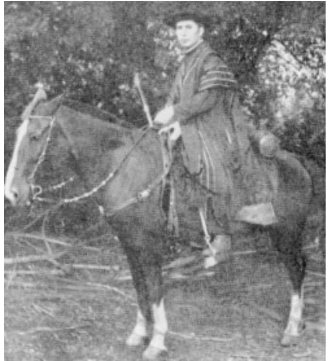
Il Venerabile padre Massimo Rinaldi in visita alle sue missioni del Rio Grande del Sud (Brasile) (Positio, I, fotografia 14)

esprimendogli con gioia la constatazione che il suo desiderio, di vedere trasferita la salma del Rinaldi, dal cimitero comunale alla cripta della cattedrale, coincideva con un'analoga proposta avanzata dallo stesso Jacoboni: «Reverendo don Publio — scriveva la Carillo —, avevo letto sull'«Osservatore Romano» del 6 giugno il voto espresso da un parroco che la salma del nostro Vescovo santo fosse riportata in cattedrale, nella cripta. Era questo il mio solo desiderio dacché ne avevo appresa la morte. Ho aspettato perciò l'«Unità Sabina» per avere maggiori raggugli, ed ecco nel Vostro articolo su questo giornale, arrivati in ritardo, vedo che la proposta è partita da Voi. Permettete perciò che vi scriva, pure essendo nel dubbio